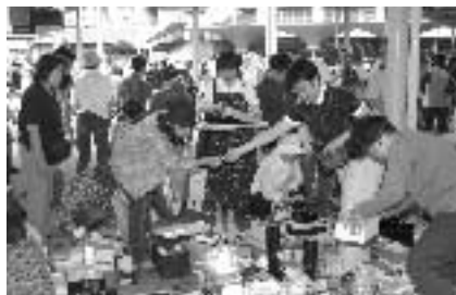
当日駐車場を用意していますが、たいへん混雑しますので、できるだけ自動車の利用をお控えください。出店の受付は既に終了しています。

思いがけない掘り出し物が見つかるかもしれません。 お問い合わせ 環境政策課環境衛生係(内線226、227)