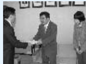
▲提案書が市長に手渡される

コラボレーション研究所がまとめた「『(仮称)向日市市民協働促進基本方針』への提案」が、このほど市長に手渡されました。