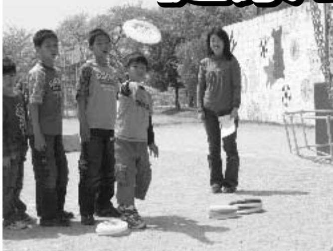
▲ワイワイスポーツクラブの設立記念イベントに子どもから大人まで約200人が集まり、スポーツを楽しみました(4月16日・向陽小学校)

「市民健康づくりの日」および「市民健康づくり推進月間」は、平成14年に市制施行30周年を記念して、子どもから高齢者まで気軽に健康づくりに取り組んでもらおうと制定したものです。