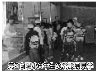
第2向陽小6年生の常設展見学

はじめて歴史を学ぶ小学6年生に、身近な遺跡である長岡京跡をはじめ、市域の遺跡を紹介。