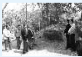
▲勝山公園周辺の現況を視察

このたび、市民と行政が協働で勝山公園を整備する「勝山公園の今日と明日を考える会」が結成されました。