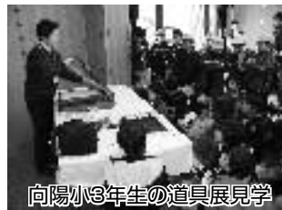
向陽小3年生の道具展見学

収蔵資料に直接触って実践する、体験学習への要望も増えてきました。日頃の研修や資料整理の成果が活かされる時です。