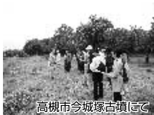
高槻市今城塚古墳にて

案内するためには研修が大切。ときには市域の歴史と関係深い、近隣の史跡を訪ねて、楽しく学んでいます。