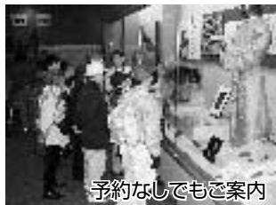
予約なしでもご案内

毎週土曜日の午前10時～午後4時には、当番制で1人常駐し、ご希望の方に展示をご案内しています。