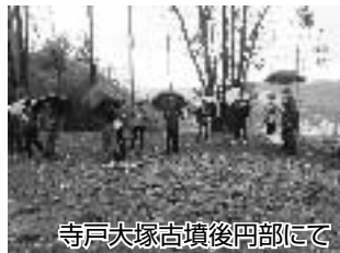
寺戸大塚古墳後円部にて

ボランティアが中心になって企画・運営する歩く会を、毎年1回開催し、多くの方々を市内外の史跡へと、ご案内しています。