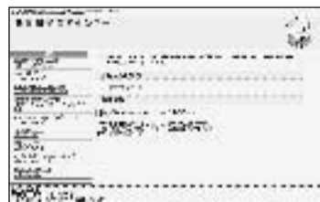
▲子育てセンターホームページ

http://www.city.muko.kyoto.jp/famisuppo/famisuppo.html