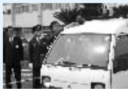
▲青色回転灯を取り付ける

4月6日、市の公用車に対する青色回転灯の標章などの交付とパトロール出発式が市役所で行われました。