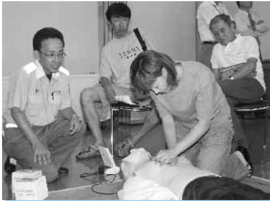
▲救急隊員から実技指導を受けて蘇生法を学ぶ(向日消防署)