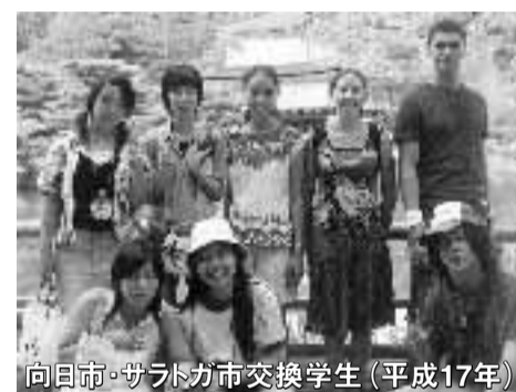
向日市・サトガ市交換学生(平成17年)