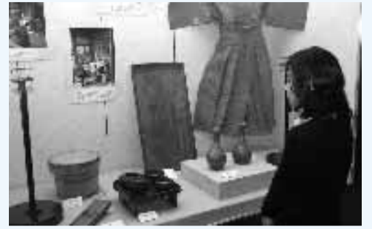
▲宮座ごとに行事で使う道具や写真パネルを展示

向日神社宮座の当番交替行事「ネンド」の展示が4月から文化資料館で行われています。