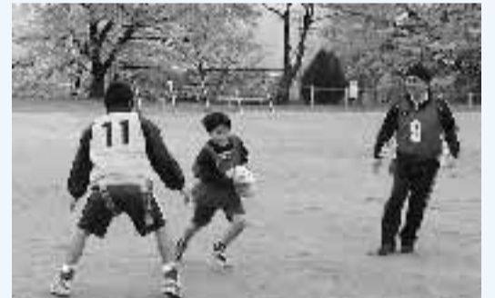
▲相手にタグを取られないように、巧みに足を運ぶ

総合型地域スポーツクラブ「ワイワイスポーツクラブ」で、平成18年度から新種目として中国武術、ラグビー、ソフトバレーボールなど5種目が始まりました。16日には向陽小学校で、ラグビーと中国武術が初めて行われました。