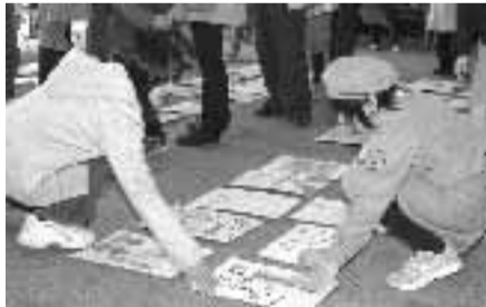
◀昨年度に開催した「ジャンボカルタ取り大会」の様子(平成18年3月5日)

優秀作品を選考して、教育長賞、市民憲章推進協議会長賞などを贈呈します。 ※表彰式とジャンボカルタ取り大会は、11月上旬を予定しています。