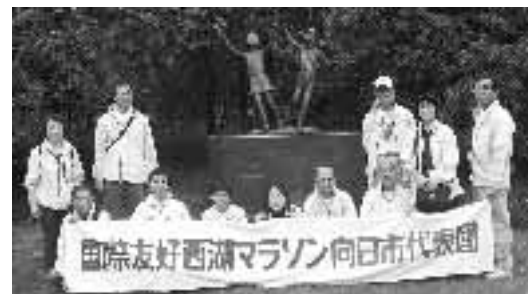
▲昨年の国際友好西湖マラソン向日市代表団