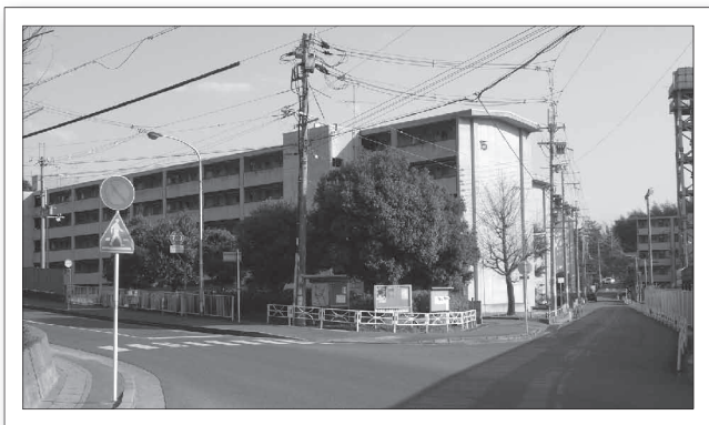
▲現在の向日台団地。北側から見たところ。右手奥が向日神社の境内へと続く竹藪。

向日神社の境内から勝山公園へ抜け、石の鳥居をくぐると、眼下に向日台団地の棟が建ち並ぶ風景がひらけます。昭和42年(1967)11月に一部完成して入居が始まり、現在は約500世帯が暮らす、市内に8つある行政区の1つです。