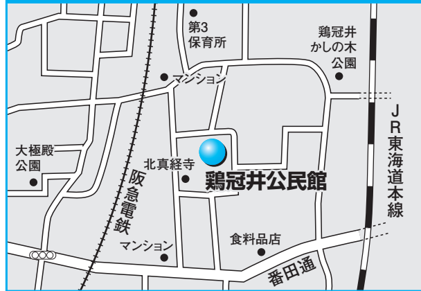
第4投票所 鶏冠井公民館