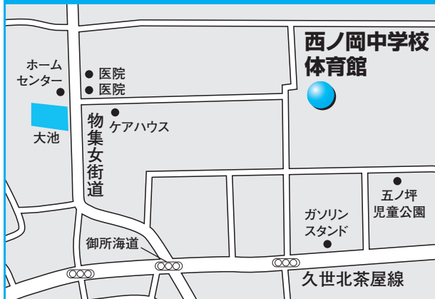
第13投票所 西ノ岡中学校体育館