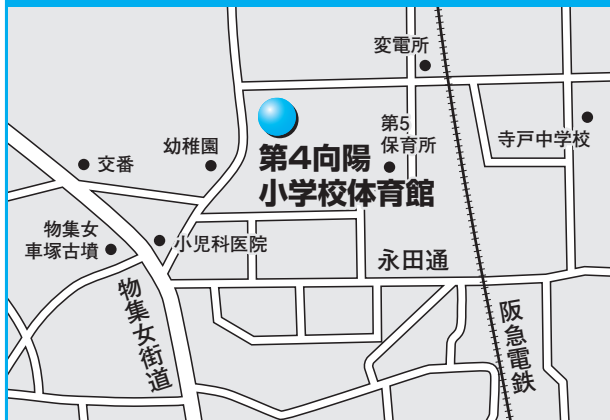
第11投票所 第4向陽小学校体育館