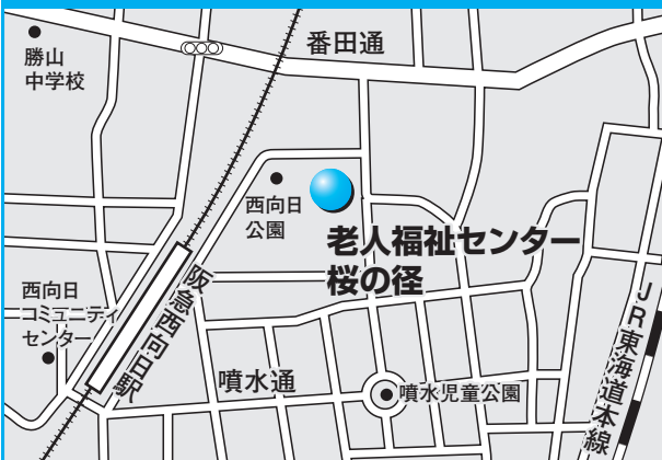
第6投票所 老人福祉センター桜の径