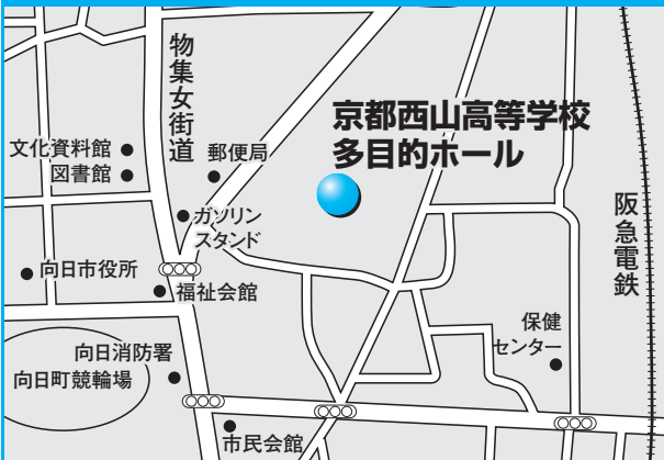
第8投票所 京都西山高等学校多目的ホール