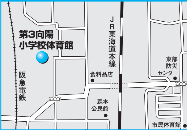
第7投票所 第3向陽小学校体育館