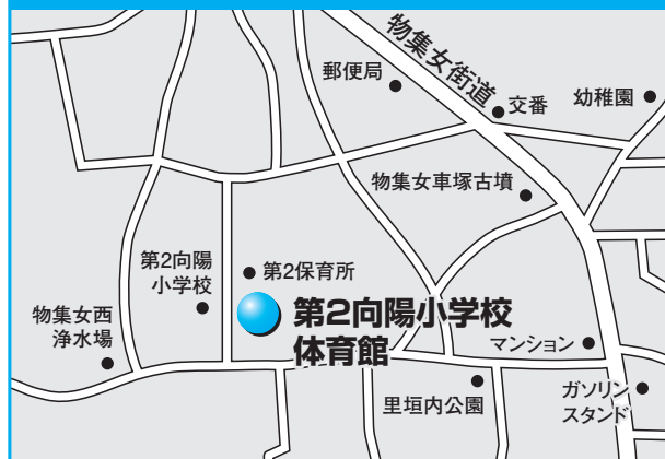
第1投票所 第2向陽小学校体育館