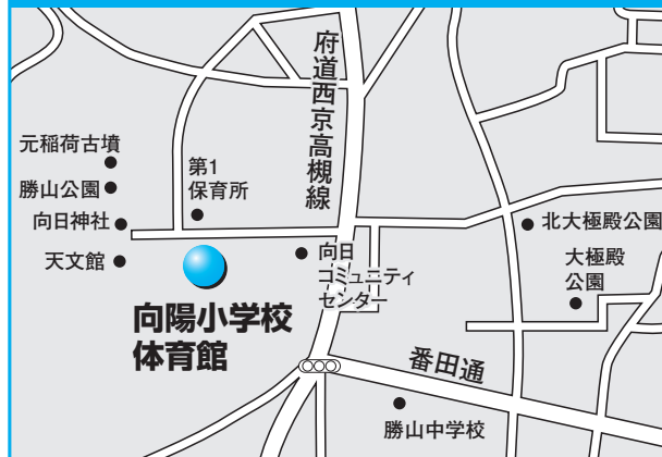
第3投票所 向陽小学校体育館