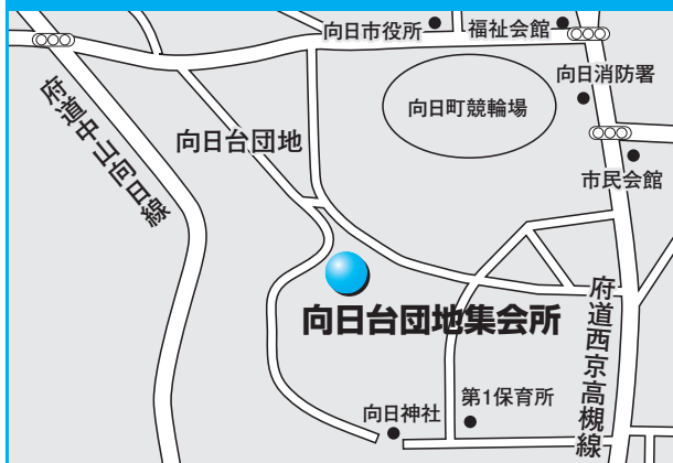
第9投票所 向日台団地集会所