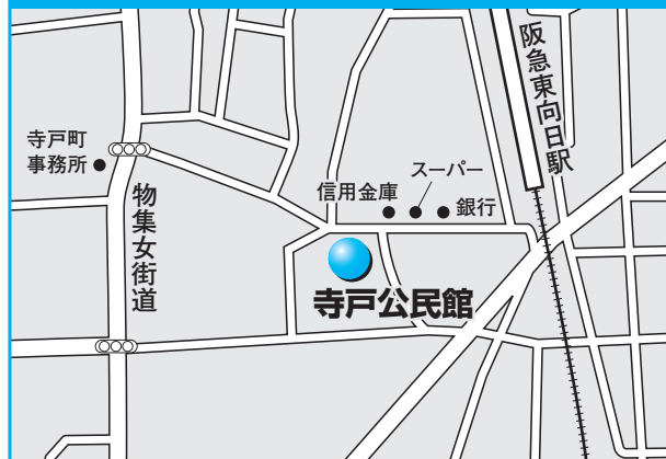
第2投票所 寺戸公民館