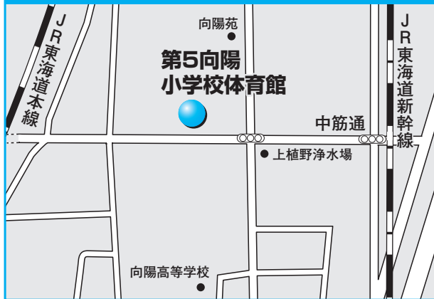
第12投票所 第5向陽小学校体育館