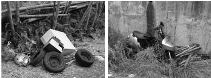
【向日市内で発見された不法投棄の現場】

右の写真をご覧ください。一体どこでしょう。これは紛れもなく皆さんが住んでいる向日市の写真です。皆さんが生活しているすぐ近くに、このような場所があるのです。