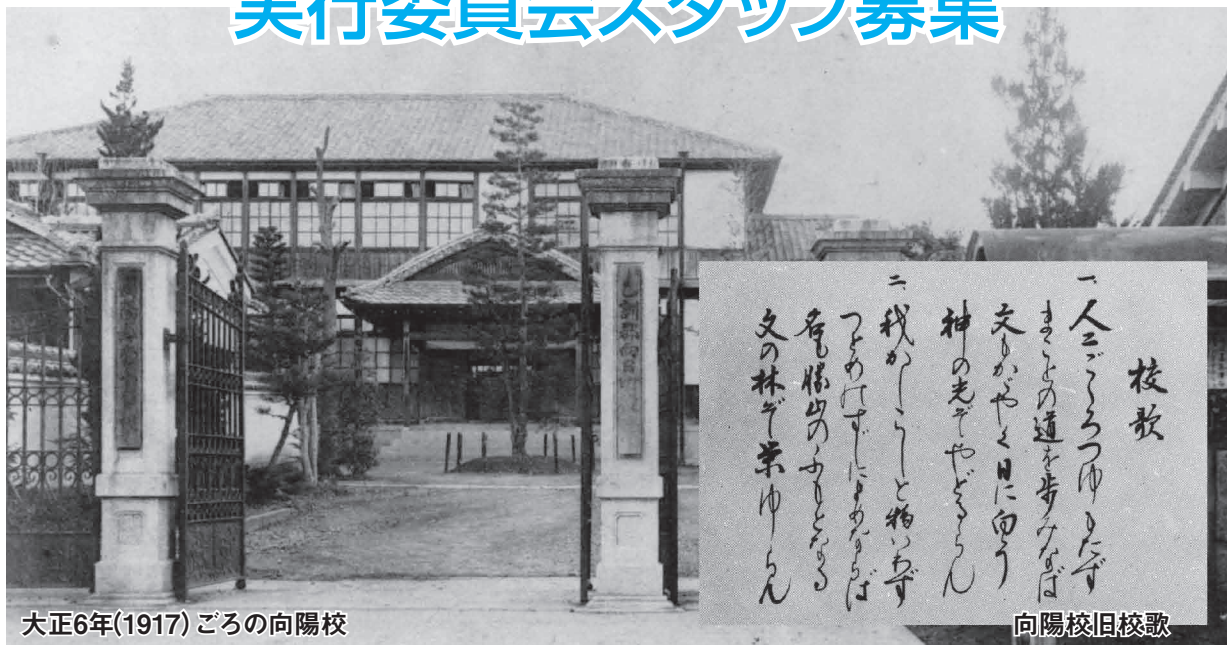
大正6年(1917)ごろの向陽校