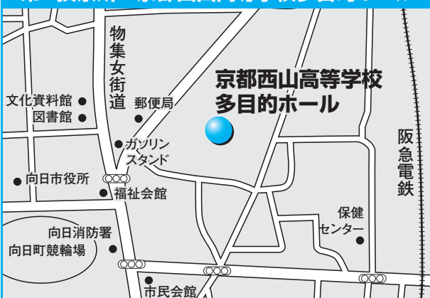
第8投票所 京都西山高等学校多目的ホール