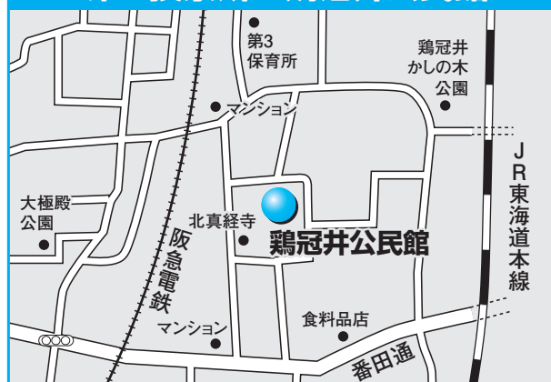
第4投票所 鶏冠井公民館