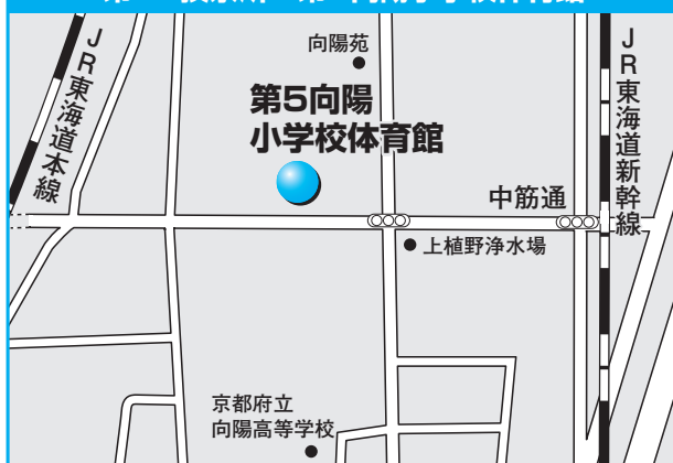
第12投票所 第5向陽小学校体育館