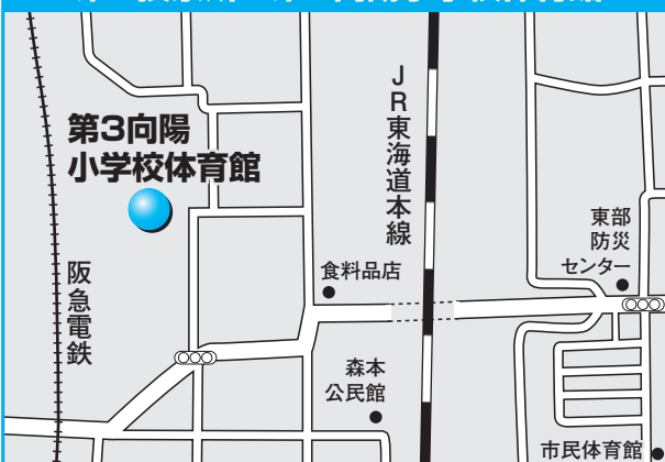
第7投票所 第3向陽小学校体育館