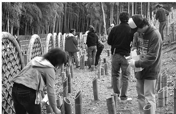
▲昨年の「竹の径・かぐやの夕べ」準備の様子

向日市観光協会は、今年で6回目となる「竹の径・かぐやの夕べ」に、昨年同様、竹筒並べなど開催当日と一緒に携わっていただけるボランティアスタッフを募集します。たくさんのご応募をお待ちしています。