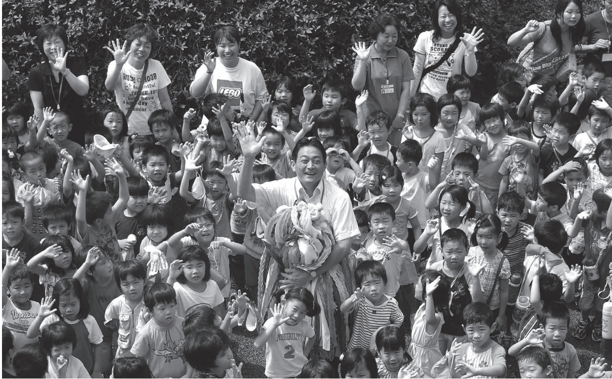
▲折り鶴を届けた保育所の子どもたちと久嶋市長

●向日市役所(〒617-8665 京都府向日市寺戸町中野20 ☎075(931)1111 FAX075(922)6587) ●編集 秘書広報課 ●http://www.city.muko.kyoto.jp/