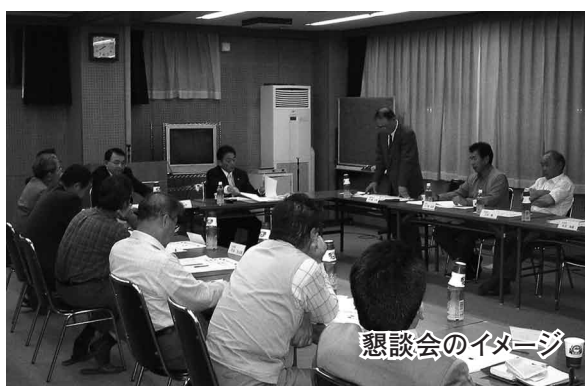
懇談会のイメージ

この「街づくり懇談会」は、まず地域自治会と行い、その後、さまざまな団体と行っていく予定です。