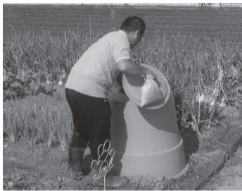
▲発酵を促進するために米ぬかを入れています。