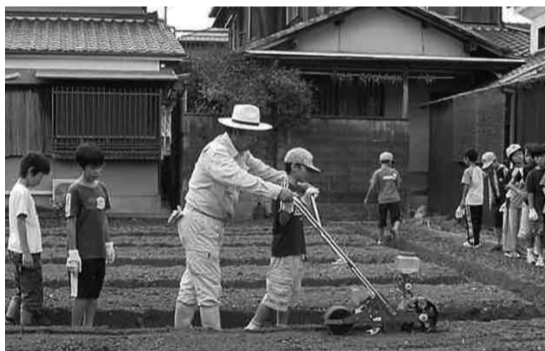
▲ 地元農家の方の指導を受け大根の種まきを体験

市内の小学校では、地元でとれた野菜や米などを給食に出すなど地産地消に積極的に取り組んでいるほか、農業体験を通して子どもたちに食の大切さを伝えています。さつまいもや大根の植え付け・収穫などを行い、それを給食で食べるなど、農作業の大変さや収穫の喜びを実感し、自然の恵みや生産者に感謝する心を育てています。