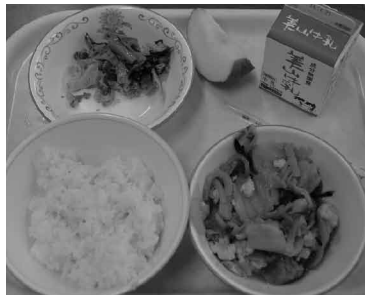
▲「すきやき煮」が主菜

ニューを導入した。向陽小の乙訓メニューの日は「乙訓の花菜とかしわのすきやき煮」。すきやき煮に使う白菜、ネギは向日市産、花菜(長岡京産)とあわせてサラダに使うキャベツも向日市産。調理員が朝か