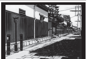
▲剪画作品(大月透さん作)