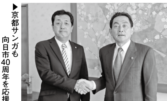
京都サンガも向日市40周年を応援

6月17日(日)午後7時~ ザスパ草津戦 西京極総合運動公園 陸上競技場兼球技場