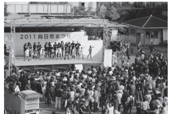
▲すっかり定着「向日市まつり」(平成23年)

向日市は千二百年を記念して、図書館、資料館を開館。五十年後に開けるタイムカプセルも埋設された。