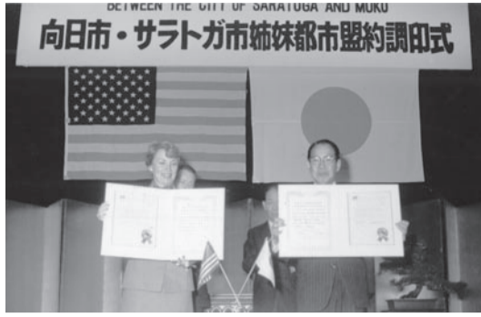
▲姉妹都市の調印(昭和59年)

国際交流は民間同士の交流が発展し、姉妹都市などにつながった。米国カリフォルニア州サラトガ市との姉妹都市盟約は五十九年に締結。翌六十年には中国・杭州市と友好交流都市を結んだ。サラトガ市とは市内の日本庭園「箱根ガーデン」の管理指導に向日市民が関わったことがきっかけになり、締結後は友好訪問団の相互派遣、交換