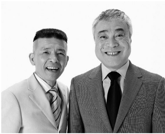
▲西川のりお・上方よしお

70歳以上の方を対象に開催します。歌謡ショーと漫才で、初秋のひとときを過ごしませんか。