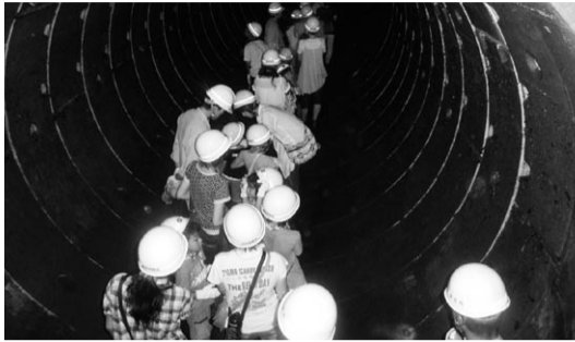
▲石田川1号幹線 市民見学会