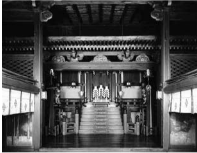
▲向日神社拝殿から本殿を望む

乙訓の建物文化をより深く理解していただけるよう、西国街道と丹波街道を歩きながらめぐるガイドツアーを2市1町共催で開催します。3年目となる今年は締めくくりの年。皆様、ぜひご参加ください。