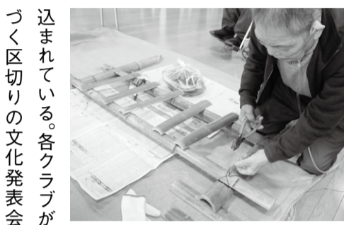
▲竹柵も慣れた手で

卒業式、修了式、そして入学式、入社式、始業式：春は区切りの季節といえる。人生の先達である高齢者が利用するデイサービスセンターも一つの区切りを迎える。向日市社会福祉協議会のセンター(寺戸町)を訪ねた。