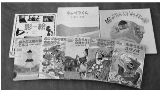
▲寄付金で購入した図書(一部)