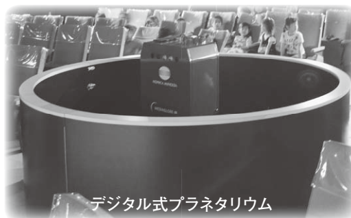
デジタル式プラネタリウム