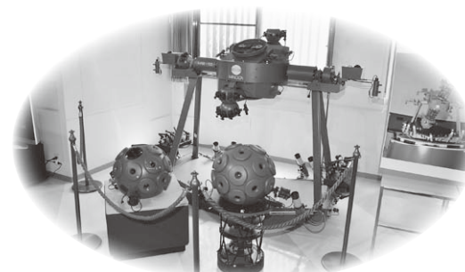
▲光学式投影機(平成24年8月まで プラネタリウム投影機として活躍)