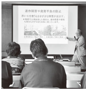
▲事業所対象のゴーヤー講習

先月、阪急東向日駅前に京都府広報監まゆまると、福知山市から「ゴーヤ先生」が登場し、企画した向陽小PTAと児童が「おうちでゴーヤーを育てませんか」「夏を涼しく過ごしませんか」と、ゴーヤーの苗や種を乗降客に配る姿を後ろから応援した。受け取る女性には「こり。向陽小は昨年、校舎に作ったグリーンカーテ