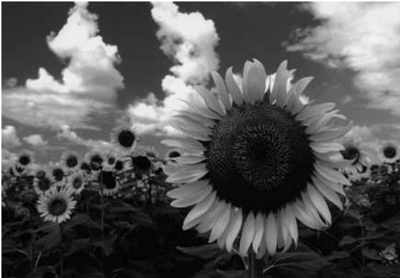
▲第16回コンテスト向日市長賞作品 「夏!向日葵の咲く街」