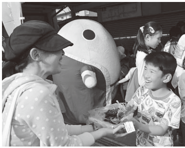
▲「育ててください」「ありがとう」