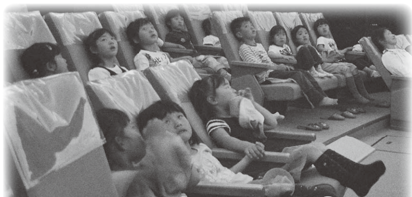
プラネタリウム投影機を 楽しむ子どもたち