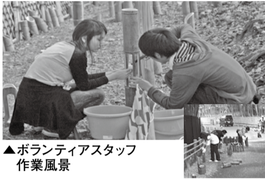
▲ボランティアスタッフ作業風景