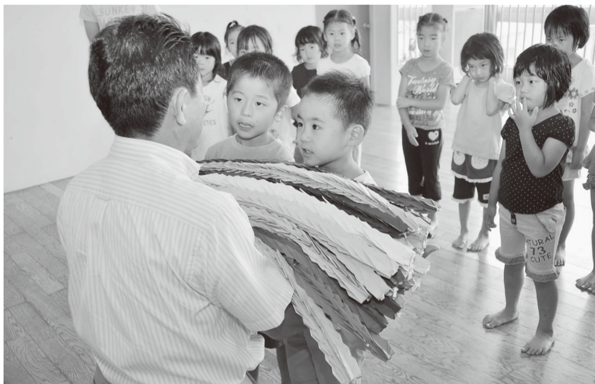
▲平和の折り鶴手渡し式(7月17日、第5保育所)