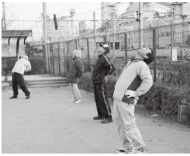
▲体を伸ばして気持ちいい

「ラジオ体操の歌」が流れるのを合図に、ポリウレムを大きくする。集まった男女七人は、