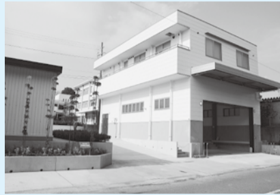
▲風水害資材倉庫(左)と道路防災倉庫(右)

災害発生時にはここを拠点とし、敏速な誘導で、通行者の安全を確保するとともに、早期に交通機能を回復し、避難者の救助活動や救援物資運搬の円滑化を図ります。また北部(寺戸町)と南部(上植野町)の2か所で避難施設の整備を進めています。