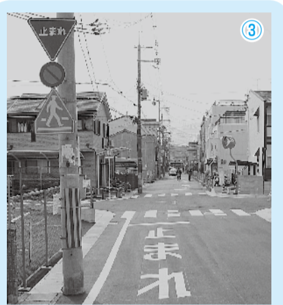
寺戸森本幹線1号の開通に伴い、寺戸森本幹線2号の東西方向が「止まれ」規制となりました。道路をご利用のときはご注意ください。