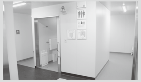
オストメイトや乳幼児用の設備を備えた多機能型トイレ