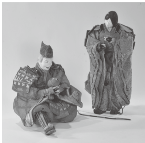
▲神功皇后と武内宿禰 江戸時代末期 寺戸町・長谷川徳造家寄贈

ているのが神功皇后、立て膝をして赤子を腕に抱くのが武内宿禰です。神功皇后で高さが五六センチもある立派な人形です。 神功皇后は、古事記や日本書紀に登場する古代の伝説的な女性で、子どもをみごもつたまま、朝鮮半島に出陣したと伝わります。帰ってきた筑紫(現在の福岡県)で応神天皇を生んだという話が、人形のモチーフになっています。武内宿禰は、同じく記紀に五代の天皇に仕えた大臣として知られている、やはり伝承上の人物で、抱いているのが後の応神天皇です。 神功皇后、武内宿禰、応神天皇はともに武神として信仰されていたので、神功皇后と応神天