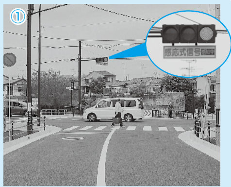
寺戸森本幹線1号と府道向日町停車場線の丁字路にある信号