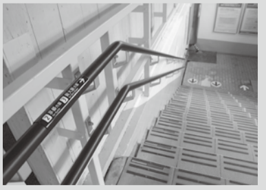
改札内地下道の2段手すり