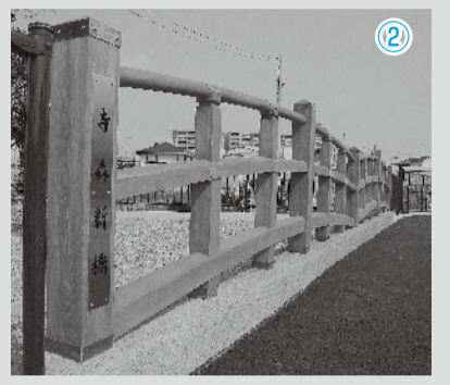
新しく架けられた寺森新橋。太鼓橋をイメージした木製の欄干と、親柱に銘板があります。