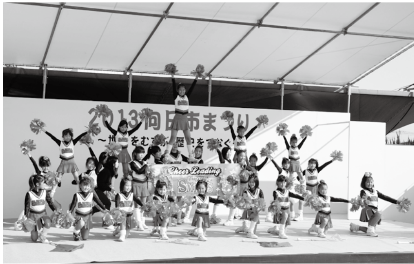
▲昨年のふるさとステージの様子

※申込みに際しては、それぞれ「市民ふれあい広場出店(展)者募集要項」「遊びの広場開設募集要項」「ふるさとステージ出演者募集要項」を必ずご覧ください。 ※申込書と募集要項は、市民参画課で配布しています。また、市ホームページからダウンロードもできます。