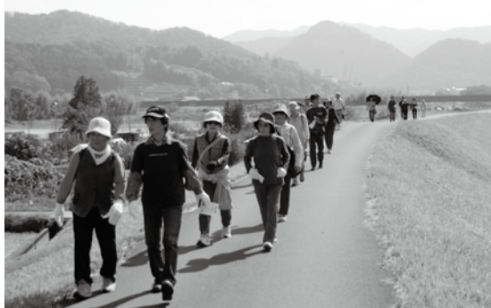
▲前回の友好交流ウォーキングの様子