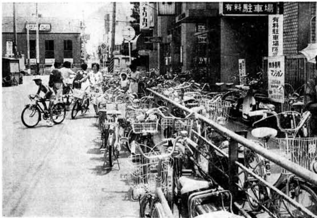
歩道にもあふれるほどの自転車、これでは街の美観も……