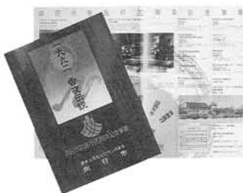
20周年記念事業を紹介するパンフレット

10月3日(土) 雨天のときは4日(日)に延期 開場 午後4時30分 開演 午後5時30分