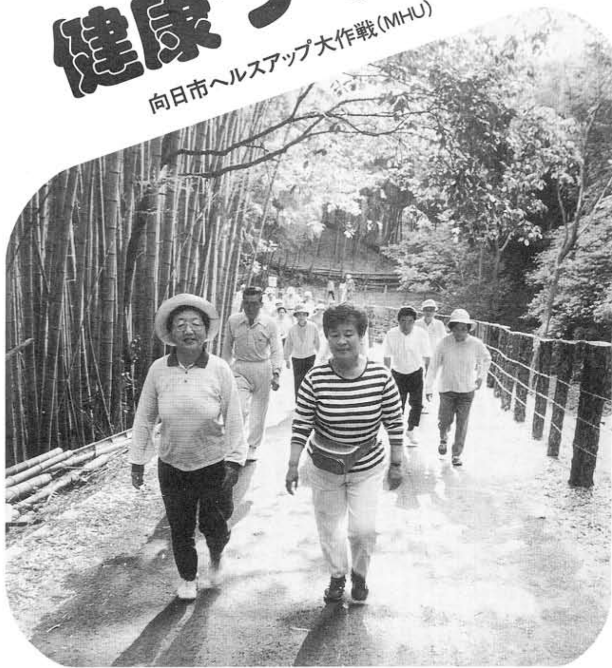
朝の竹林はひとさわさわやかです 竹林コース(火・土 午前6時30分～ 第2向陽小学校から竹林を歩きます)