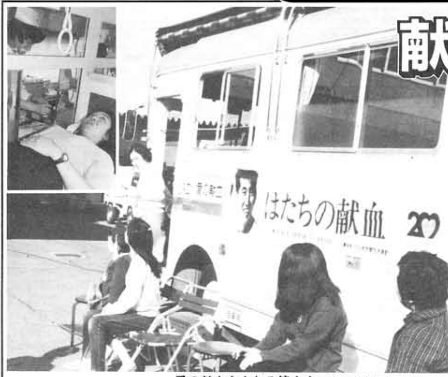
愛の献血をされる皆さん—市役所玄関前—

向日市献血推進実行委員会では、市民の皆さんに献血の意義を理解してもらい、年間を通じて計画的に献血に協力していただけるよう、毎月20日を献血デーと定めて、献血運動に取り組んでいます。 献血会場も、向日市内全域の方がなるべく近くの会場で献血できるように、各地域の公民館・寺戸コミュニティセンター等を活用し、このように、向日市献血