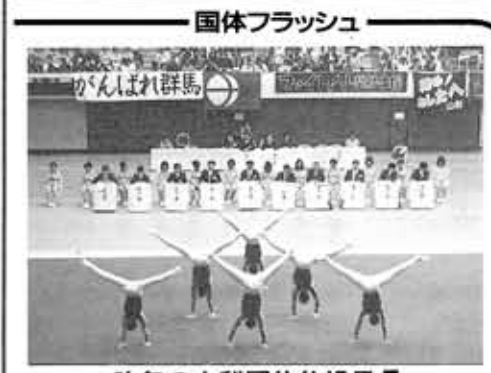
今年の山梨国体体操風景