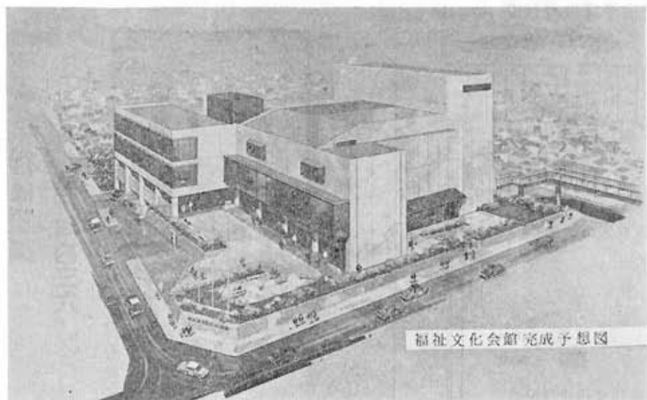
福祉文化会館完成予想図