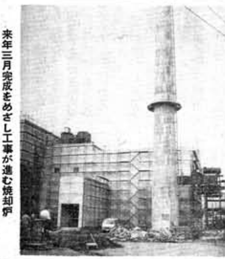
来年三月完成をめざし工事が進む焼却炉