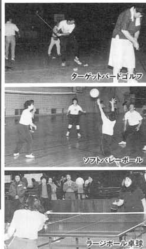
ターゲットバードゴルフ