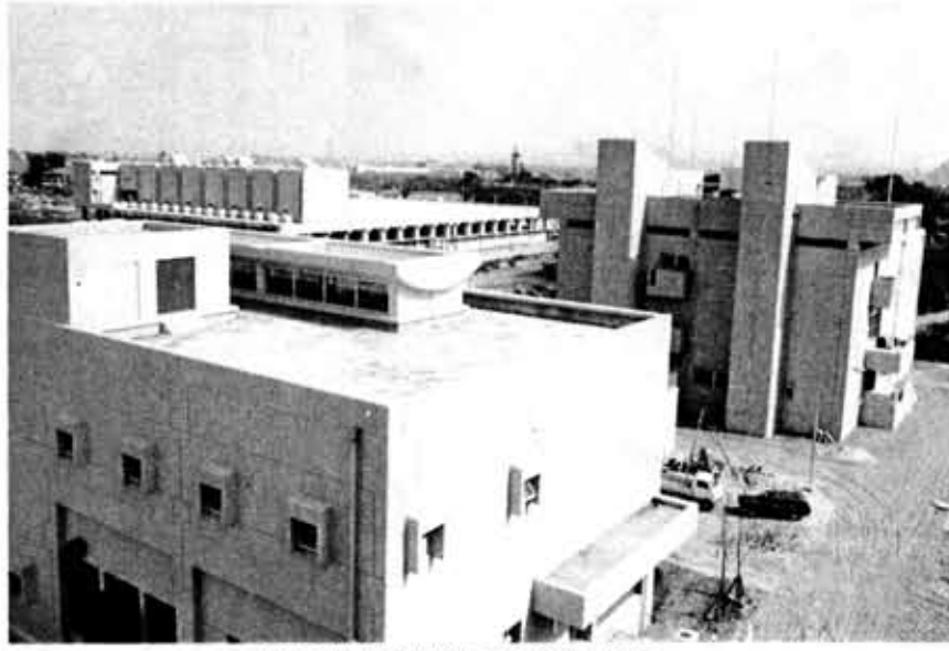
10月の供用開始を待つ洛西浄化センター