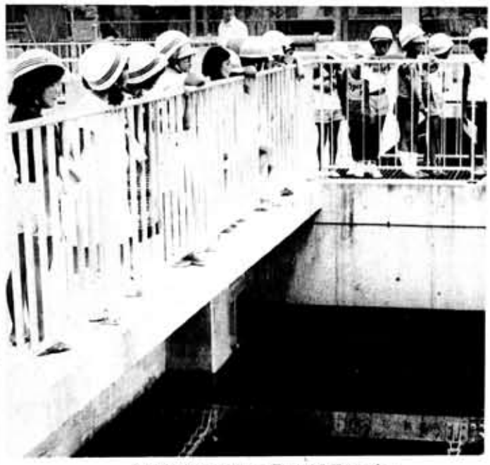
洛西浄化センターを見学する子どもたち