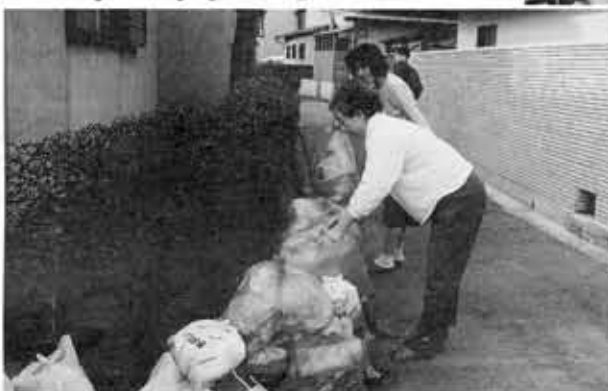
ごみは袋に入れて朝8時までに出しましょう