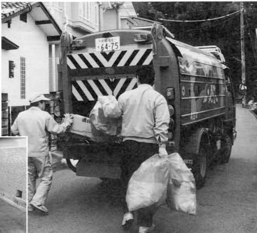
ごみの収集がしやすいようにご協力をお願いします

生活様式の変化に伴い、家庭から出るごみの量は年々増え続けています。向日市で、昨年1年間に排出されたごみの量は1万6307トン(推計)。これは、市民1人あたり1日約840gのごみを出していることとなります。 市では、昭和53年から分別収集を実施し、ごみの減量化・再資源化に取り組んでいます。しかし、いまだに燃えるごみにビン、カンを混ぜて出したり、決められた日以外の日にごみを出す人がいます。このため、ごみが散乱したり分別できないなどの問題が起きています。 もう一度、ごみの正しい出し方を確認していただき、快適なまちづくりのため、みなさんのご協力をお願いします。