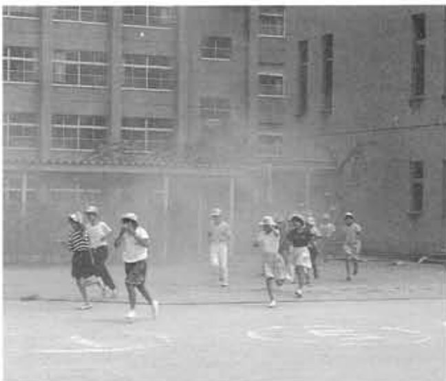
立ち込める煙の中、真剣に避難する子どもたち(第5向陽小、一昨年)