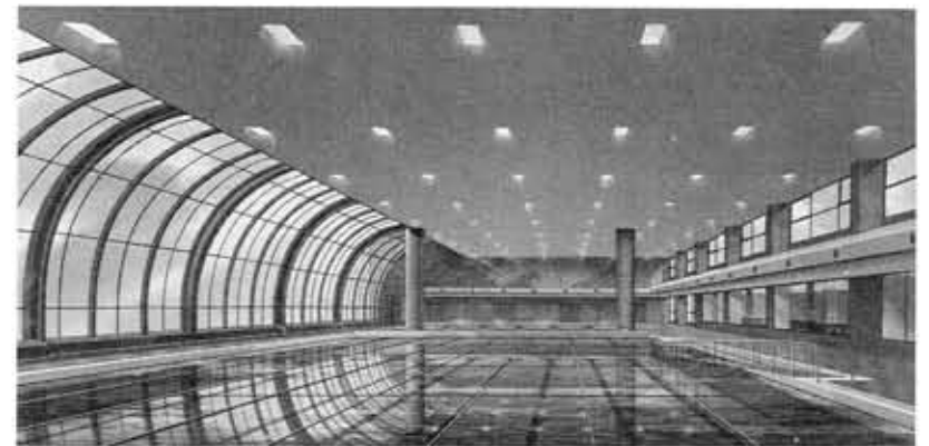
▲25mプール(完成予想図)

鶏冠井町上古8-1 (市民ふれあい広場南隣)に計画を進めていた(仮称)向日市民プールの建設工事が始まりました。この市民プールは、年間を通じて利用できる温水プールで、市民の健康と体力づくり・ふれあいを高める場として整備するものです。建設費は、17億6542万円を予定し、国の支援事業(地域づくり事業)を受けて実施します。