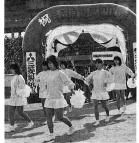
第二部のパレードには、バトンガールも参加