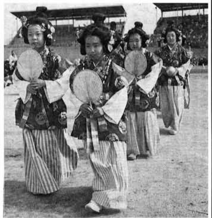
チビッコも今日はしずしずと……