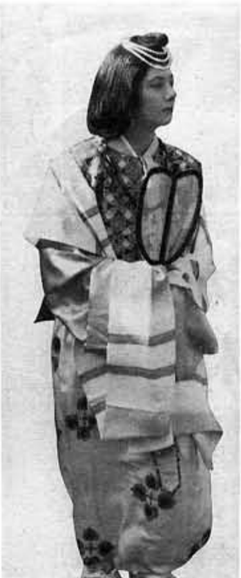
優美な女官で米国女性も参加