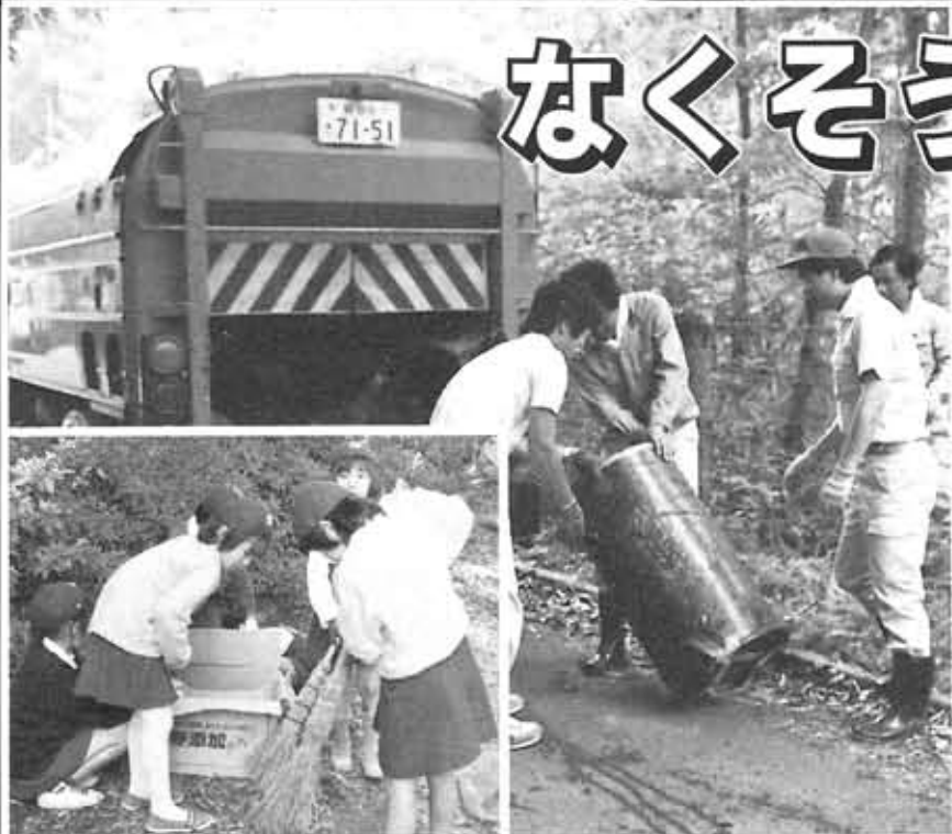
ガールスカウトによる公園清掃 不法投棄物を回収する職員