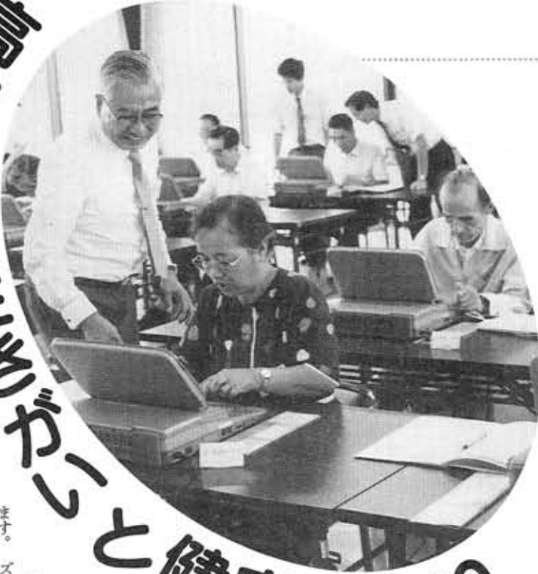
ワープロにチャレンジする 高齢者のみなさん (高齢者ワープロ教室から)

国のモデル事業の指定を受け、平成3年度から2カ年計画でスタートした「高齢者の生きがいと健康づくり推進モデル事業」に市民の大きな関心が集まっています。この推進モデル事業は、高齢者が、家庭、地域、企業など社会の各分野で、豊かな経験と知識・技能を生かすこと、生涯を健康で、かつ、ポジティブな活動で過ごすことを目指しています。また、健康づくりとして、20台購入したワープロを使って、総合的に取り組んでいくことを目的としています。