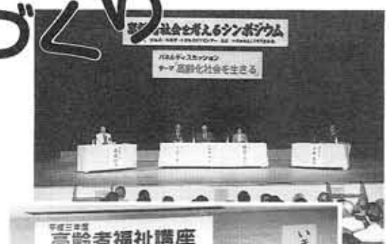
▲シンポジウムでは、市民もパネリストに ▲生きがいを求めて — 高齢者福祉講座 —

総合的に取り組んでいくことを目的としています。また、健康づくりとして、20台購入したワープロを使って、総合的に取り組んでいくことを目的としています。