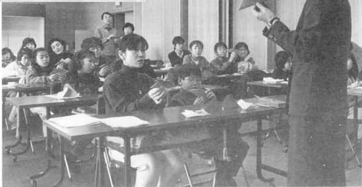
講師の手元を見つめるおかあさんの目は真剣そのものです