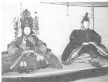
古今びな(明治初期)

ひな人形の源流といわれる奈良時代の呪いの人形から、戦前の一般家庭のひな飾りまでを展示中です。