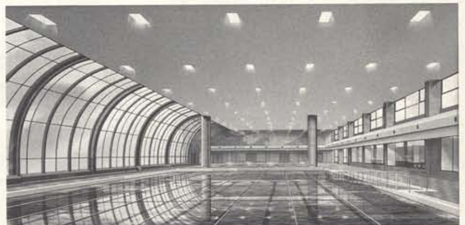
25mプール(完成予想図)