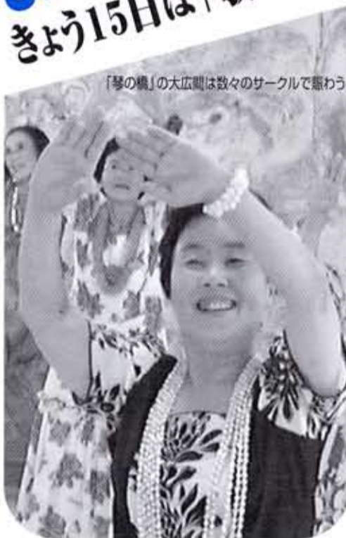
「琴の橋」の大広間は数々のサークルで賑わう