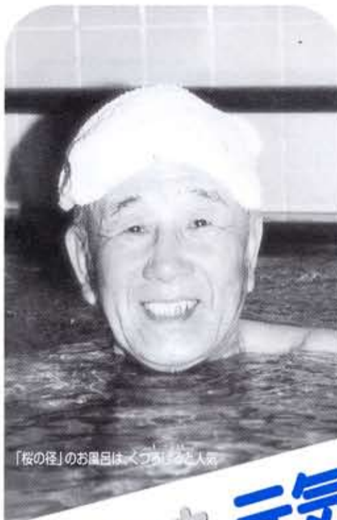
「桜の径」のお風呂は、くづりたてと人気