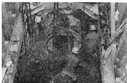
下水道工事も順調に――森本町――

5月から新たに下水道課がスタートします。 市の下水道事業は、昭和49年10月から工事に取りかかり、 今年度で4年目をむかえています。工事が進むと同時にその 事務量も年々多くなってきています。このため市では、いま までの「下水道係」を「課」に昇格させ、事業の促進をはか っていきます。 今後とも市民のみなさんの下水道事業に対するご理解とご 協力をお願いいたします。 なお、下水道課は市役所3階の建設産業部に所属します。