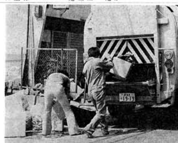
(ゴミ収集車もフル運転)

半日で三回処理場へ ここでは、乙訓二市一場へ三往復、ゴミ収集の作業員に「どうや」と聞かれ、「しんどいわ」とたたき一言、とにかく疲れた一日でした。