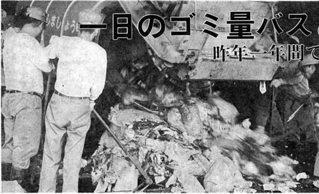
(毎日のゴミを乙訓環境衛生組合ゴミ処理場で処理)

清潔で住みよい生活をのぞむわたしたちにとって、ゴミ処理は一日も欠かさない大切な問題となってきました。市でも、市民の暮らしの周辺整備の施策として、ゴミ対策に取り組んでいます。しかし、生活の高度化と多様化に伴い、ゴミの量質とも複雑化してきた現在、ゴミ問題も住民とともに考える時期にさしかかっています。