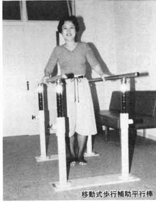
移動式歩行補助平行棒