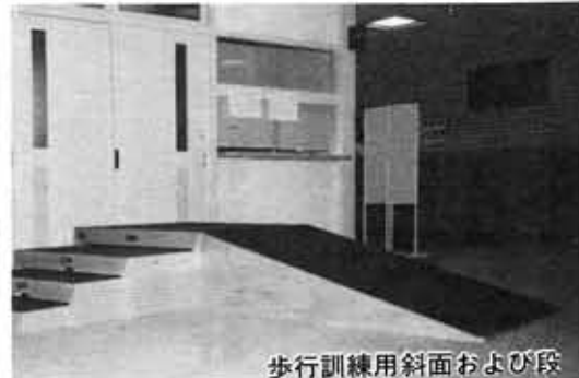
歩行訓練用斜面および段