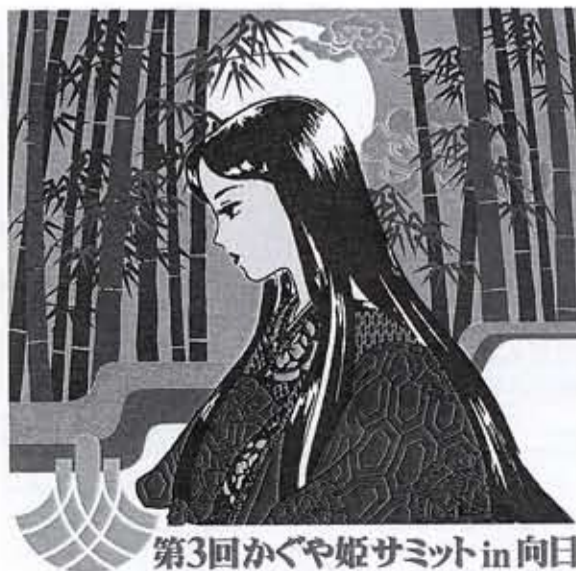
第3回かぐや姫サミットin向日

平成7年1月のオープン以来366,000人(平成9年9月末現在)を超える利用者で賑わう市民温水プール。水泳による健康づくりと体力向上に、初心者から種目別までのプログラムで開催している水泳教室や、子どもたちを対象にした少年・少女水泳教室や、一般水泳者に気軽に水泳の手ほどきをするワンポイントレッスン等を行っています。青年から80歳代のお年寄りが、初級(42.195km)中級(100km)上級(246km)の完泳を目指して、水泳マラソンを頑張っています。