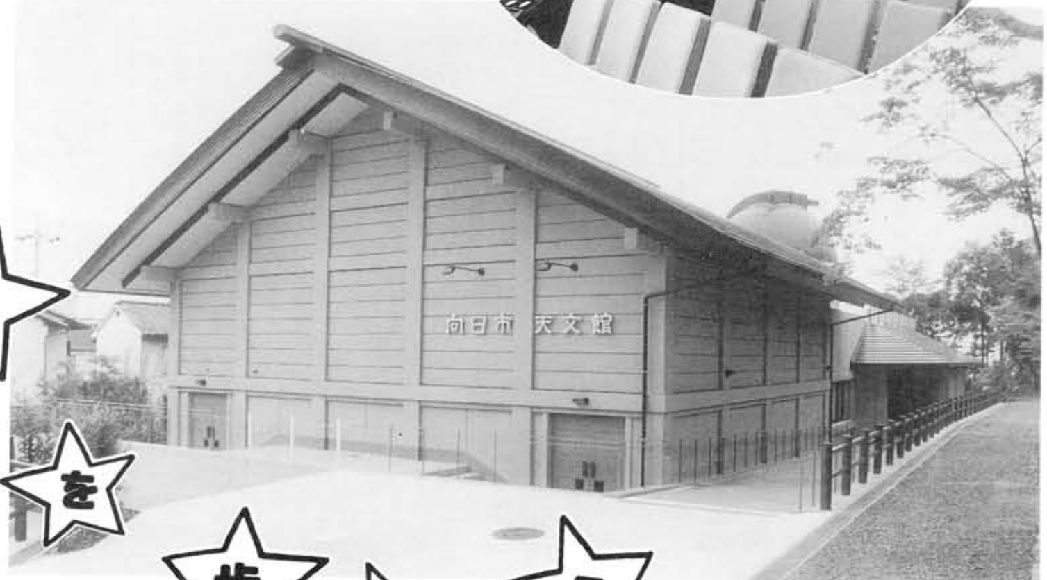
夢がいっぱい向日市天文館