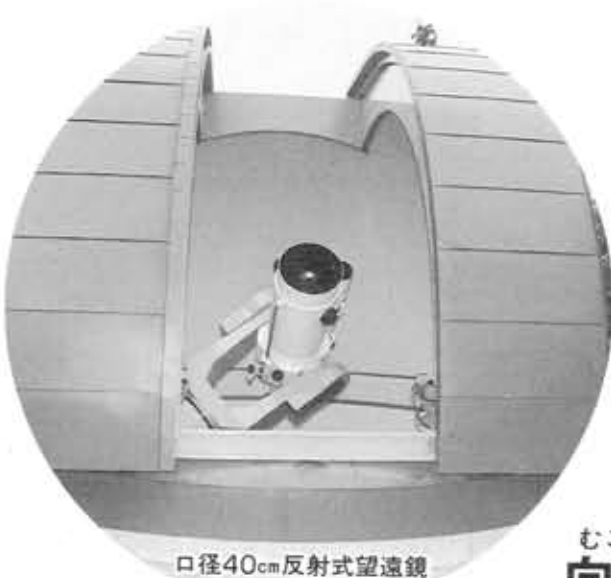
口径40cm反射式望遠鏡