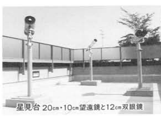
星見台 20cm・10cm望遠鏡と12cm双眼鏡

むこう 向日市天文館 〒617 向日市向日町南山82-1 ☎ 075-935-3800