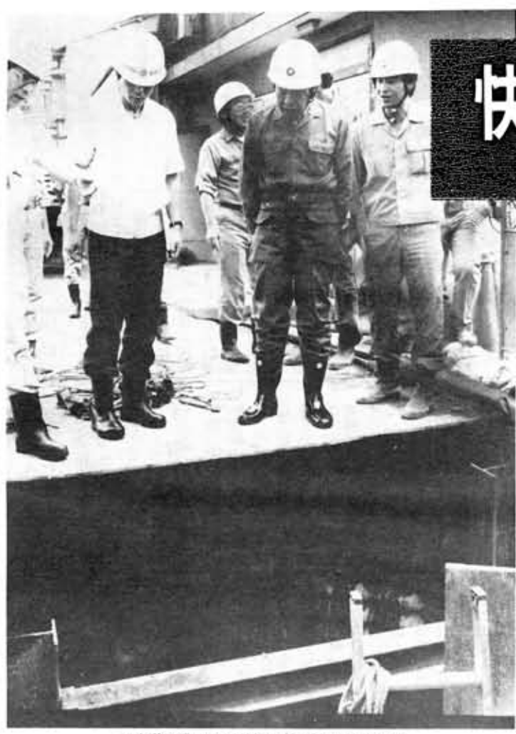
下水道の進ちょく状況を視察する民秋市長

No.360 昭和60年9月1日 ◎発行 向日市役所(京都府向日市寺戸町中野20) ◎編集 秘書広報課 ◎電話 075(931)1111