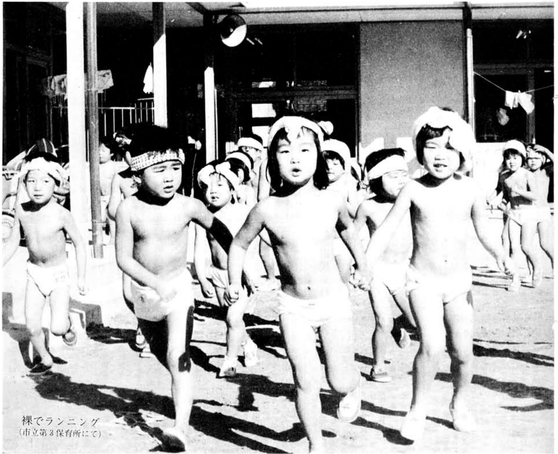
裸でランニング (市立第3保育所にて)