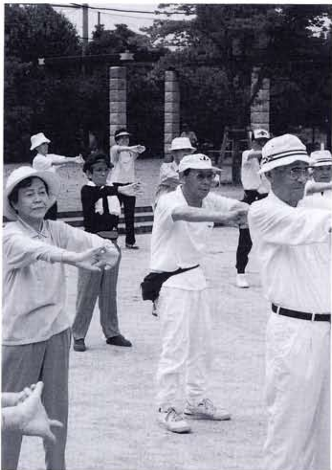
住み慣れたまちで安心して暮らすことが一番の願いです

高齢社会が目前に迫り、だれもが健康で安心して暮らしていきたいと思っています。病気で寝たきりになったり、痴呆症などで介護が必要となったときの不安は、誰でもあります。老後のこうした不安を取り除き、安心して暮らすために、「介護保険制度」が平成12年4月から始まります。