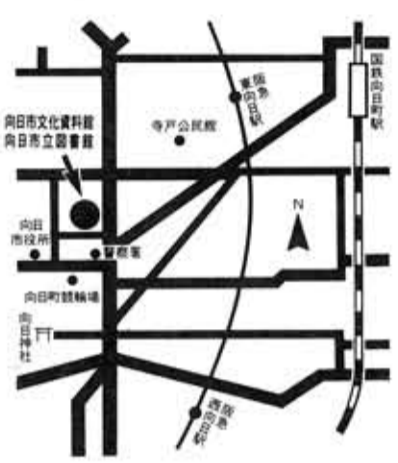
〔図書館・文化資料館位置図〕