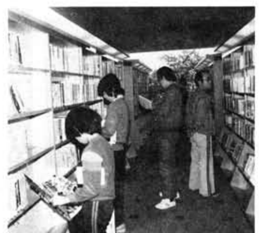
見やすく並べられた一般図書室