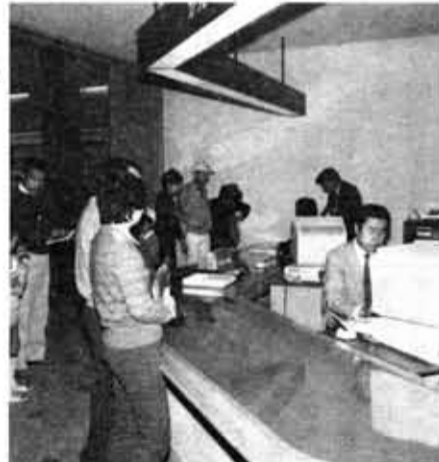
コンピューター導入の受付