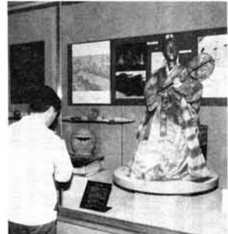
華麗な往時の衣装も再現