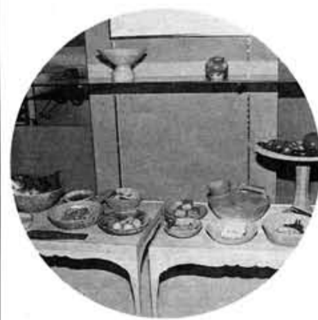
陳列された当時の貴族の食事