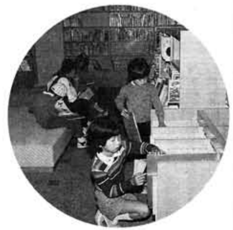
親しみやすい児童図書室