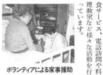
ボランティアによる家事援助

市では、高齢者福祉施策を行政の重点課題として向日市高齢者福祉基本計画に基づき、高齢者福祉大学の開設や、高齢者福祉ネットワークの積極的な活動など、事業充実にとり組んでいます。 在宅老人などの家事援助や、ひとり暮らし老人への配